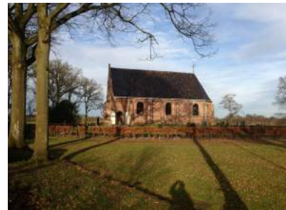
Thomaskerkje in Mildam (officiële trouwlocatie van gemeente Heerenveen)

Natuurlijk is ieder huwelijk weer anders. Daarom kunt u bij Tjaarda aangeven wat u graag wilt. Wij maken dan een programma op maat!